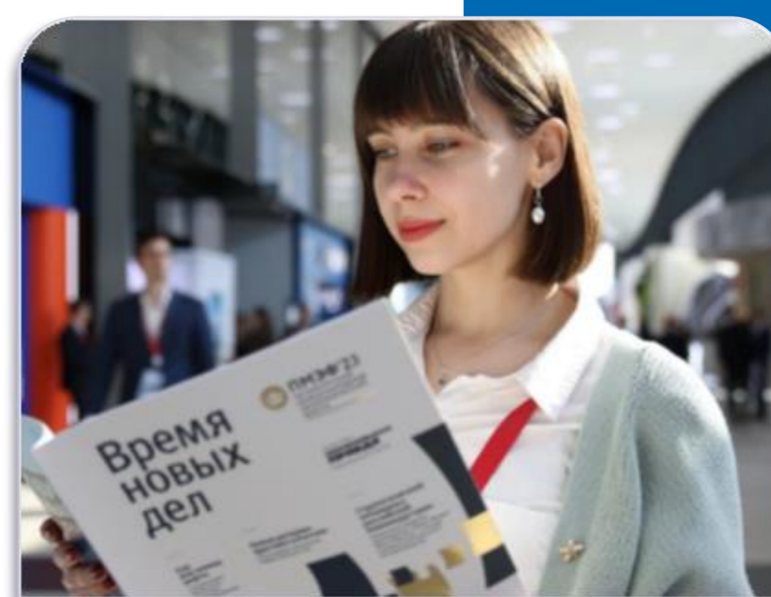
Журнал к форуму