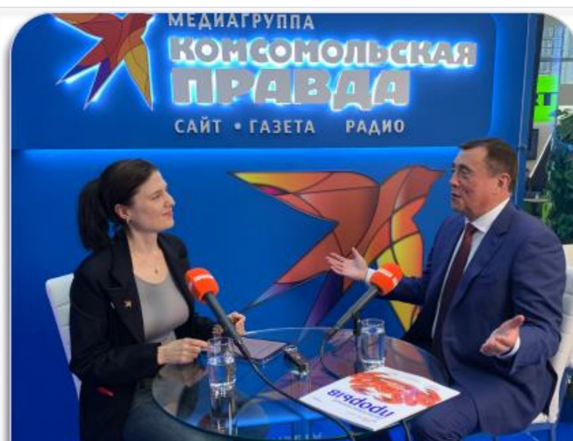
Радио «КП» • Подкаст