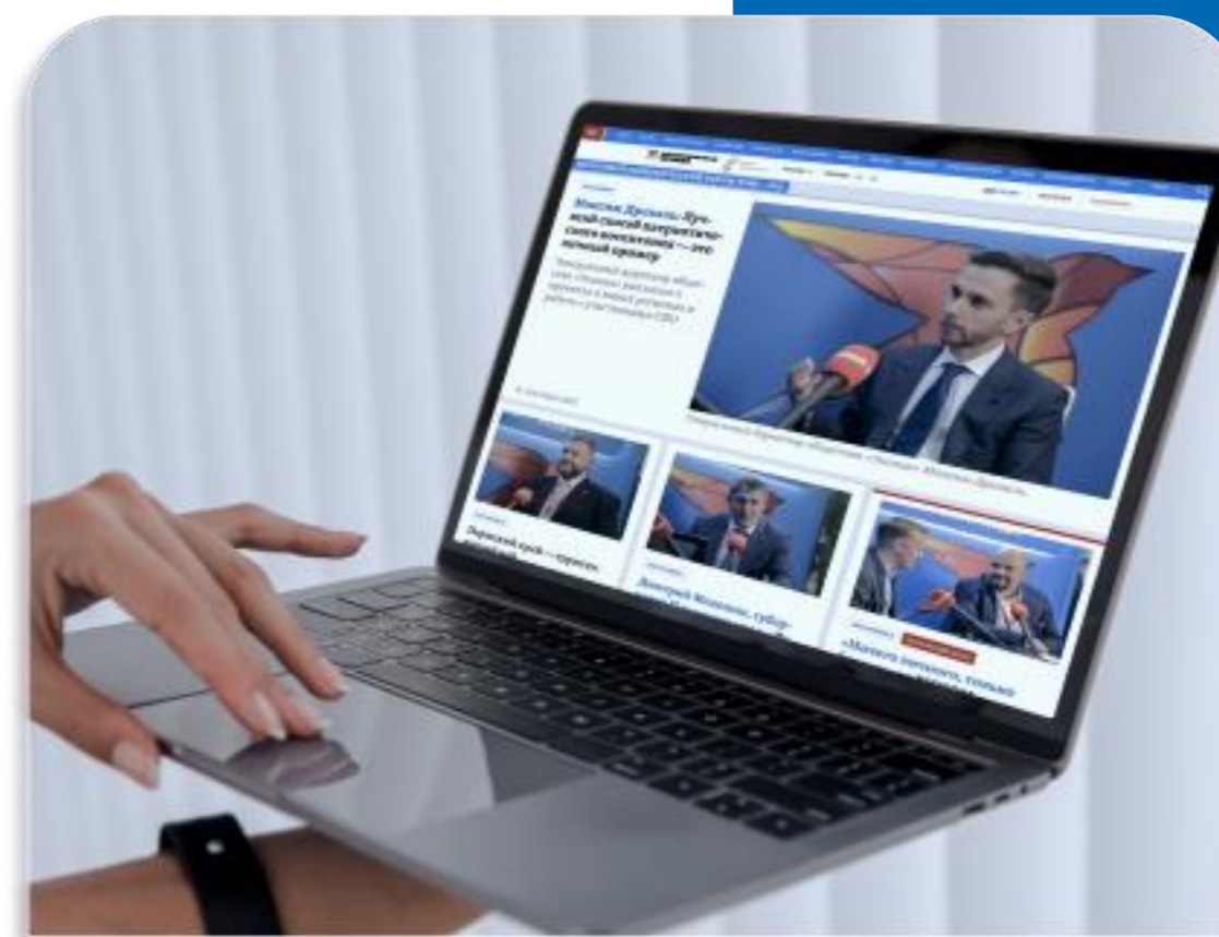
Раздел на сайте kp.ru