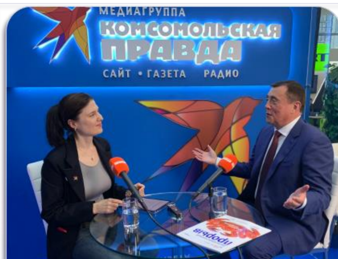
Радио «КП» • Подкаст