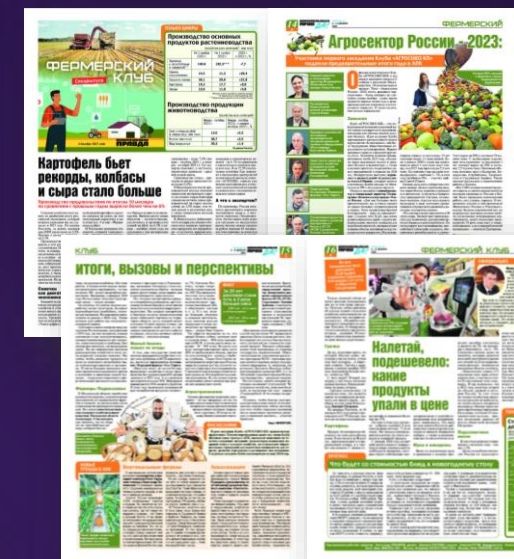
Выпуск «фермерский клуб»